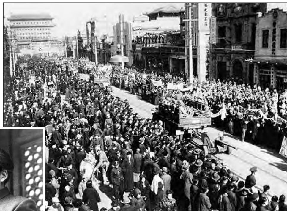
Ejército Popular de Liberación ingresa a Pekín 1949

Mao, ya a cargo del timón de la República Popular China, dedicará un importante tiempo a la elaboración de un aparato teórico y filosófico que respalde su accionar político. Esa elaboración no solo será tomada por los partidos maoístas,