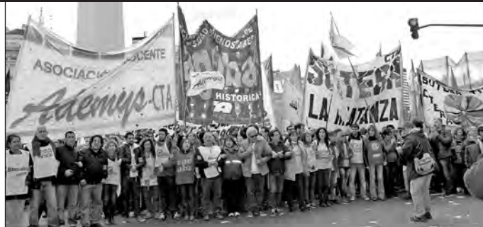
El sindicalismo combativo marchó desde el Obelisco

La declaración exigió “la reapertura de las paritarias”; denunció a los “governado-