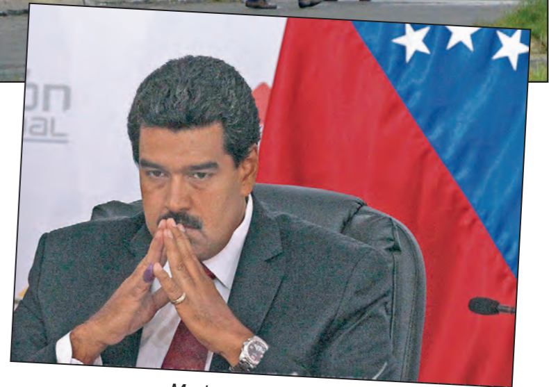
Maduro en problemas

El centro de la pugna está en los lapsos para la realización del referendo revocatorio. La MUD consiguió el 2 de mayo 1,8 millones de firmas solicitando el referendo. El 24 de junio ratificaron su firma 400 mil personas, y ahora se espera por la fecha en la que se deben recoger las cuatro millones de firmas que activarían el referendo. El Consejo Nacional Electoral (CNE) pretende que la recolección se realice a finales de octubre y que el referendo se efectúe después del 10 de enero de 2017. Si Maduro pierde el referendo antes de esa fecha se convocarán elecciones presidenciales de forma inmediata; de perderlo luego, su vicepresidente asumirá el cargo. Aprovechando esta pugna, el CNE