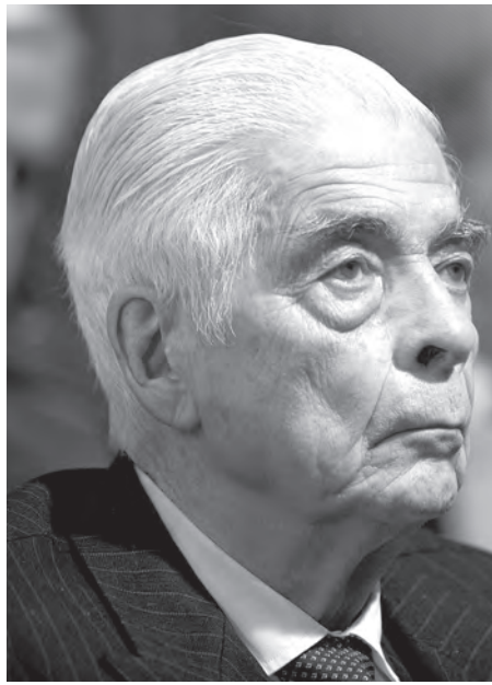
El genocida Menéndez debe ir a cárcel común