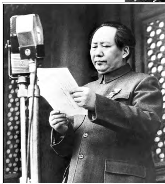
Mao Tse-tung proclamando la fundación de la República Popular China. Pekín, 1949

Esto fue llamado "Frente Popular", y tuvo expresiones concretas en países como Francia y España. En China, tras la invasión japonesa de 1937, Mao adopta esa estrategia reconociendo al gobierno burgués de Chiang Kai-shek, con el que venía tiroteándose sistemáticamente. Tras la guerra triunfante contra Japón, en enero de 1946 se sella un acuerdo entre el Partido Comunista Chino (PCCH) y el Kuomintang (el partido de gobierno) para allanar un camino de paz social y gobierno de coalición. En ese momento, Mao controlaba territorios con más de cien millones de habitantes. Sin embargo, rápidamente Chiang Kai-shek se envalentona y rompe el acuerdo, atacando las zonas bajo control del PCCH. Meses pasan con el PCCH dubitando. Los campesinos pobres, impacientes, reaccionan con ocupaciones de tierras, y una enorme rebelión en el norte chino empuja la