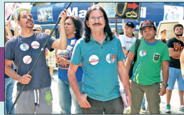
Babá en campaña

En octubre hay elecciones municipales y en ellas hay que denunciar con fuerza desde el PSOL, el partido de izquierda opositor, a los tres partidos del ajuste. La necesidad urgente es derrotar el plan de ajuste y para eso, como lo sostiene la CST/PSOL (UIT-CI), hay que apoyar y unificar las múltiples luchas de los trabajadores y exigir a la CUT y demás centrales obreras que en vez de campaña "contra el golpe", organicen una huelga general por ¡Fuera Temer!