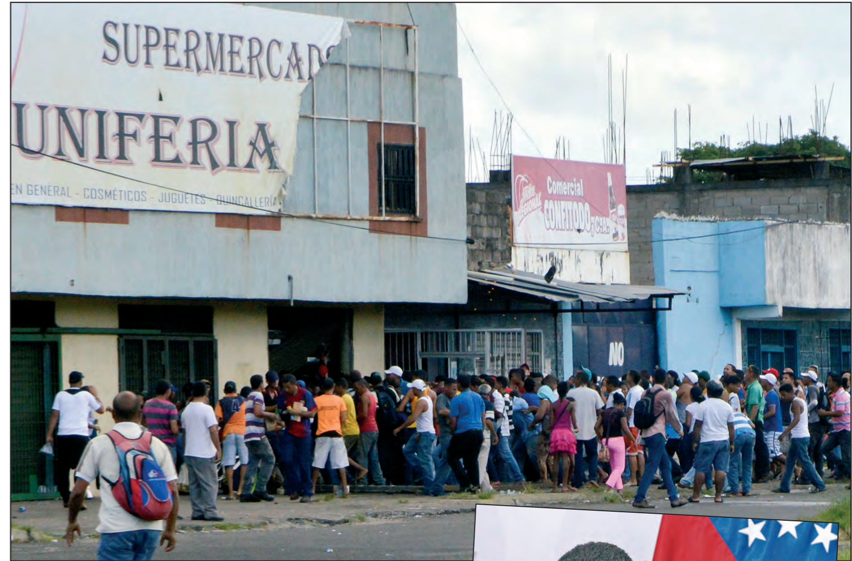
Largas colas para adquirir un alimento diario

El ajuste empobrecerá aceleradamente a la clase trabajadora. No hay cifras oficiales, pero según la encuestadora Datanaálisis el 43% de los hogares sufre escasez de