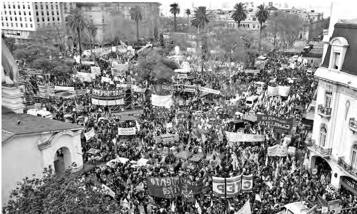
Vista de la marcha en Plaza de Mayo

Miles se congregaron en Plaza de Mayo. Predominaron las columnas de docentes y estatales. El documento leído reclamó un paro general junto a la CGT. El sindicalismo combativo marchó con una columna exigiendo “paro general CGT CTA”. Hay que reclamar ahora esa medida desde las asambleas y cuerpos de delegados.